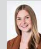
Theresa Heumader Platz 31