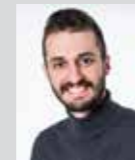
Dan Rattan Platz 23