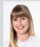
Iris Dietrich Platz 24