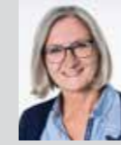
Veronika Bogner Platz 18