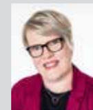
Vera Spörl Platz 34