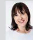
Corinna Weiß Platz 41