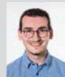
Georg Mitterbauer Platz 27