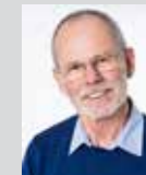
Erich Kopp Platz 33