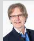
Andreas Dietz Platz 25