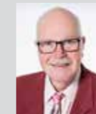
Dr. Harald Bähr Platz 30