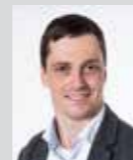
Patrick Ehgartner Platz 36