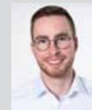
Jonas Ellinger Platz 28