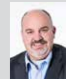
Bernhard Kuisl Platz 44