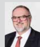
Jürgen Dupper Platz 1