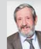
Dr. Wieland Zirbs Platz 32