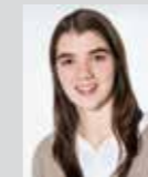
Lorena Puqja Platz 29