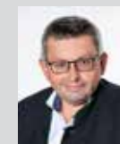
Wolfgang Wagner Platz 11