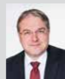
Markus Sturm Platz 3