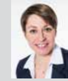
Claudia Roßgotterer Platz 20