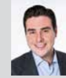
Felix Kohn Platz 19