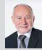
Manfred Springinklee Platz 12