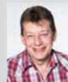
Harald Beismann Platz 38