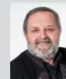
Wolfgang Schwenk Platz 40