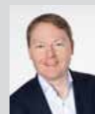
Christian Flisek Platz 5