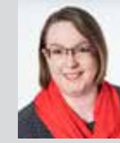
Julia Manetsberger Platz 22