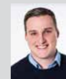
Johannes Just Platz 9