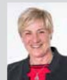
Eva Schabl Platz 37