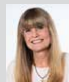
Karin Kasberger Platz 2