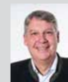
Hans-Jürgen Bauer Platz 7