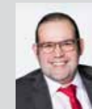
Tobias Kalb Platz 43