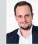
Eric Tylkowski Platz 21