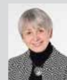
Sissi Geyer Platz 6