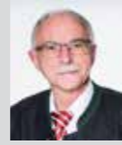
Franz Eibl Platz 13