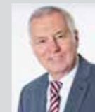
Wolfgang Meyer Platz 39