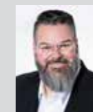
Andreas Rother Platz 8