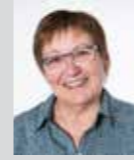
Elisabeth Ljubisic Platz 16