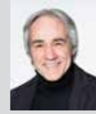
Friedrich Gerstl Platz 15