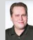
Michael Wegner Platz 42