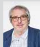
Ivan Kuba Platz 35